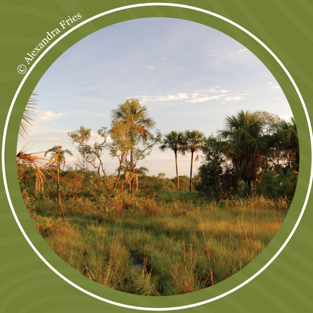
La Reserva La Lindosa es una importante área protegida en el Guaviare.

Aunque existen importantes registros históricos de la rica biodiversidad de la subcuenca del Guaviare, es necesario contar con más información actual y sistemática para el monitoreo. Además, no se logró información suficiente sobre los temas de certificaciones agrícolas y pecuarias, estado de valores culturales vinculados con el río, acceso al agua potable y productividad pesquera para incluirlos en el reporte actual, permanecerán como temas a tratar en reportes posteriores.