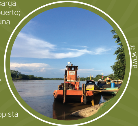
El Guaviare es un importante corredor para el transporte fluvial

Los ríos fueron por muchos años la principal arteria que comunicaba la Orinoquía, pero el mejoramiento y ampliación de la malla vial ha disminuido notablemente el tránsito de pasajeros y carga por estos gigantes de agua. Hace 10 años, en el puerto de San José del Guaviare, siete embarcaciones de pasajeros y cinco de carga llegaban diariamente al puerto; ahora sólo se movilizan una o dos. Aún así, las cifras del año 2015 muestran que 990 pasajeros y 2,139 toneladas de víveres, bebidas, material de construcción, combustibles y abonos para los sembrados de palma de aceite, se movilizaron por esta autopista fluvial que no ha perdido vigencia.